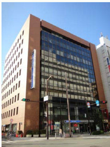
梅田イーストビル