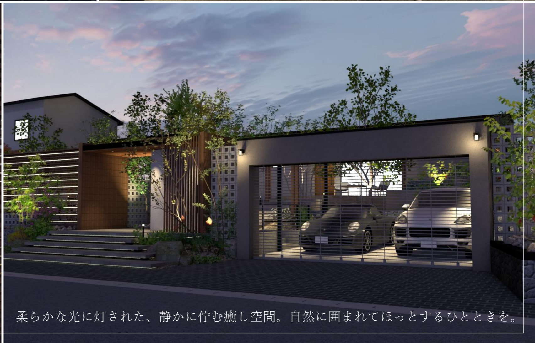
柔らかな光に灯された、静かに佇む癒し空間。自然に囲まれてほっとするひとときを。