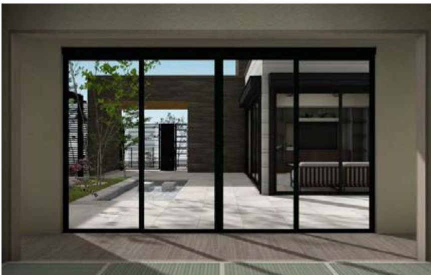
③和室から庭を眺める