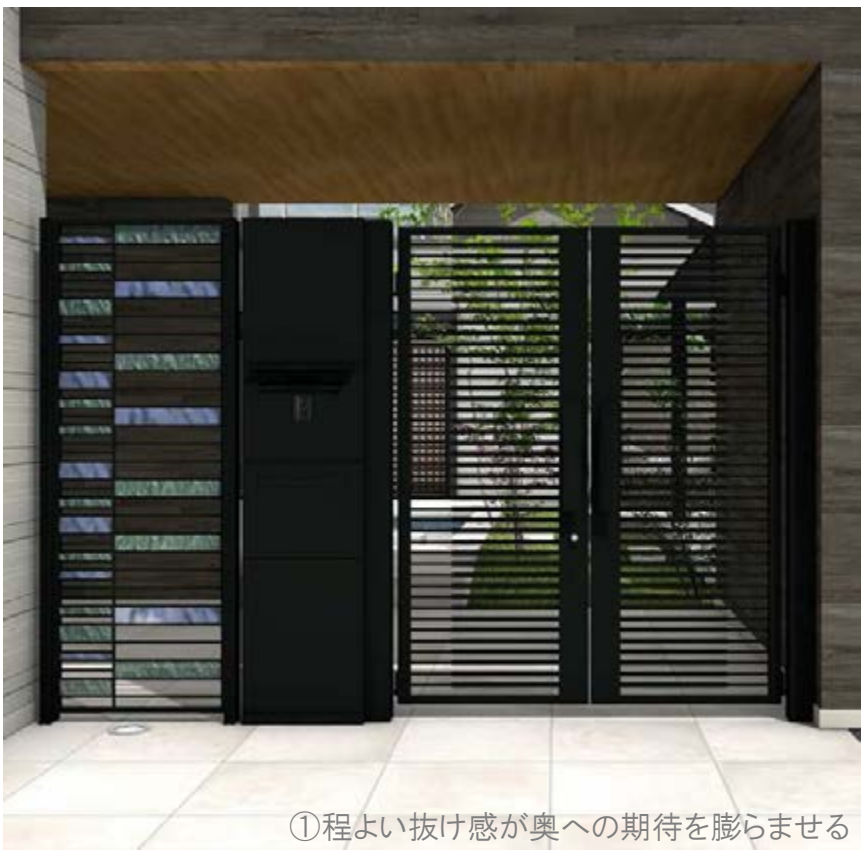
①程よい抜け感が奥への期待を膨らませる