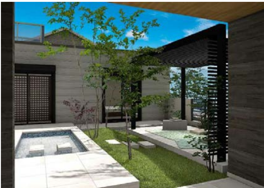
②門をくぐると開放的な庭が姿を現す