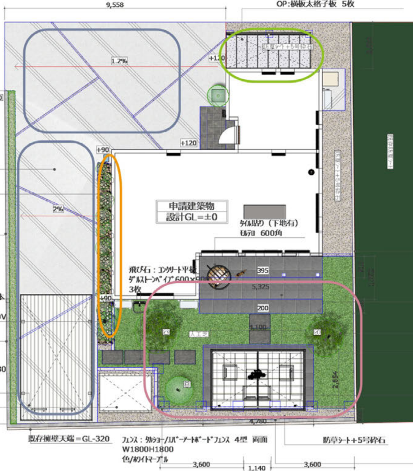
平面図 100 : 1

土留め: 型枠アクリル2段 (天端=設計GL±0) タイル: 外窓/アクリル壁付タイプ 4型 両面 H1800W3600 2枚 色/約イマール 見切り色/アザミ色 デザイン床 II タイプ: H1800W1200(1-1/2) 照明: 外窓/アクリル壁付タイプ 4型 100V 2箇所